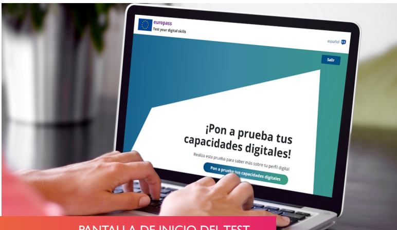
PANTALLA DE INICIO DEL TEST