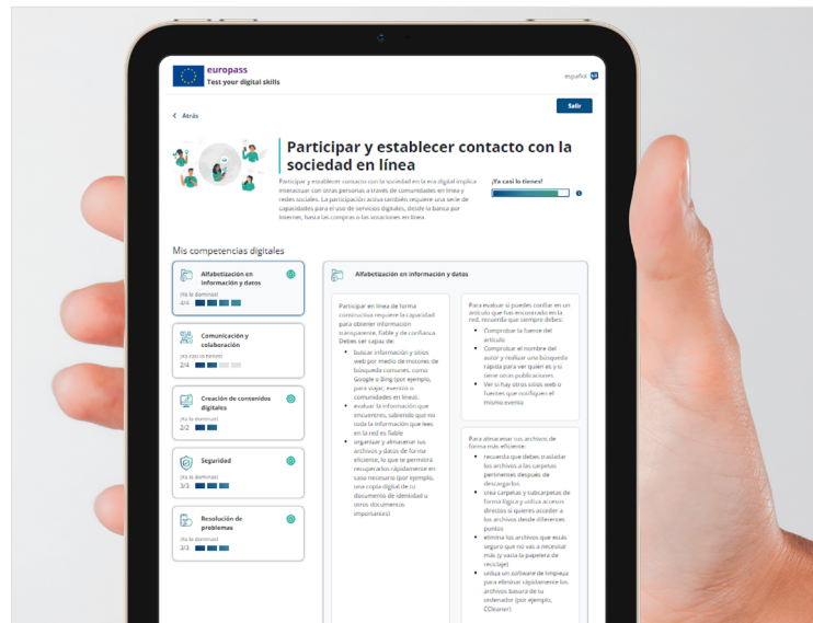
PANTALLA DE EJEMPLO DE INFORME OBTENIDO

Registrar las capacidades digitales. Después de completar la prueba, los usuarios podrán añadir sus